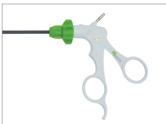
Maryland handgreep reusable style