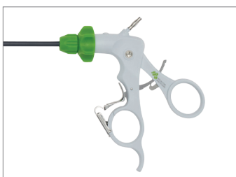
Handgreep reusable style