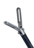
Rechte paktang, gefenestreerd