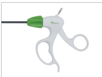
Maryland handgreep single-use style