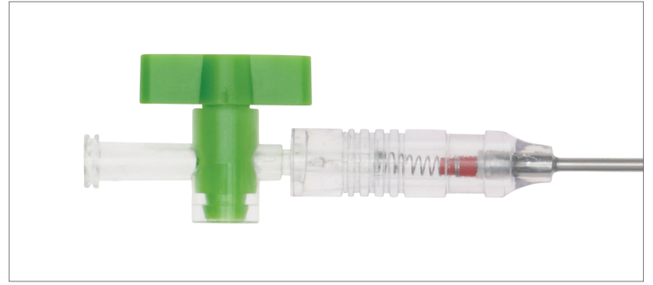
Corps de l'aiguille de Veress