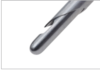
Spidsen af veress kanyle