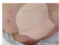
Aplicación Mepilex Border Sacrum