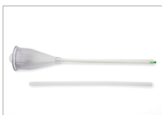
Höftrevisionsmunstycke (Ftalatfri PVC)